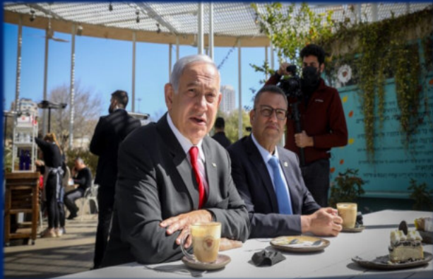
네타나후 수상과 예루살렘 시장, 모세 레온

또한 사우디는 이슬람의 진정한 성지인 메카와 메디나를 홍보하는 캠페인을 실시했으며, 이슬람 종교에서 예루살렘의 중요성을 경시했습니다. <Israel Today>