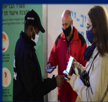
콘서트를 관람하기 위해 '그린패스'를 보여주기